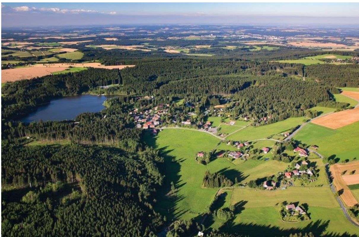
Letecký pohled na obec Tři Studně, 2017